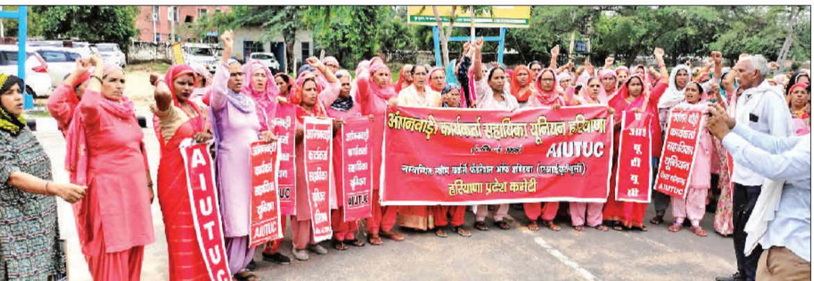
नारनौल। लघु सचिवालय में प्रदर्शन करती आंगनबाड़ी वर्कर।