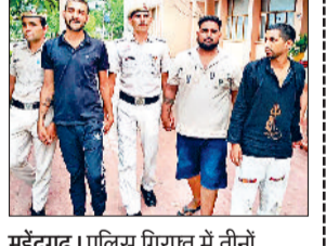
महेन्द्रगढ़। पुलिस गिरफ्तार में तीनों आरोपित।