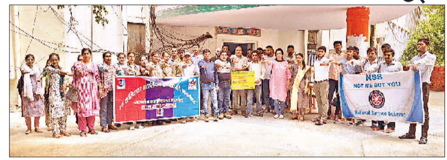
नारनौल। पीजी कॉलेज में विद्यार्थियों को नशा न करने की शपथ दिलाते हुए।

नशे की लत से पीड़ित व्यक्ति परिवार के साथ समाज पर बोझ बन जाता है। युवा पीढ़ी सबसे ज्यादा नशे की लत से पीड़ित है।